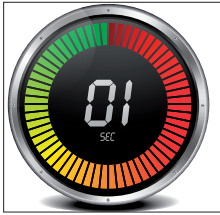
Sekundenschneller Wechsel zwischen Spalt- und Kontaktschweißen