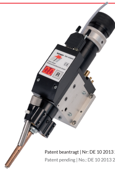
Patent beantrag | Nr: DE 10 2013 201 463 A1 Patent pending | No.: DE 10 2013 201 463 A1